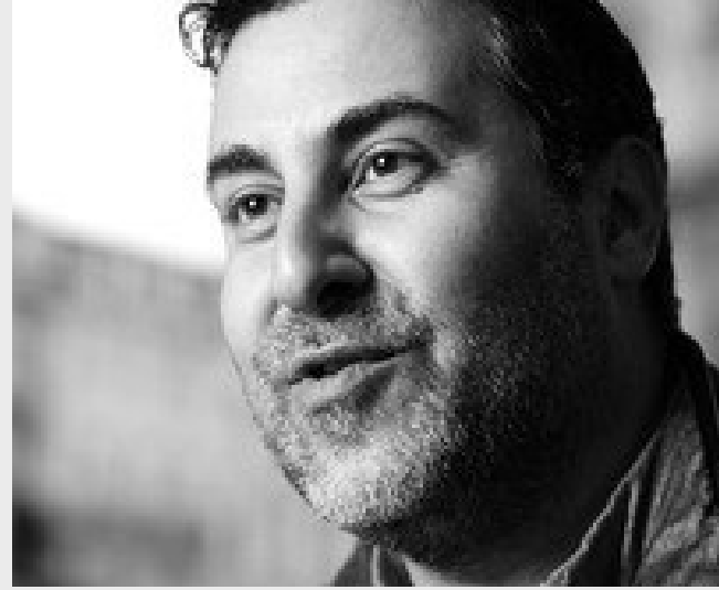
Dyab Abou Jahjah auteur en opiniemaker

'Autochtonen die vrezen dat ze een minderheid worden: dat gevoel van vervreemding moet bespreekbaar zijn'